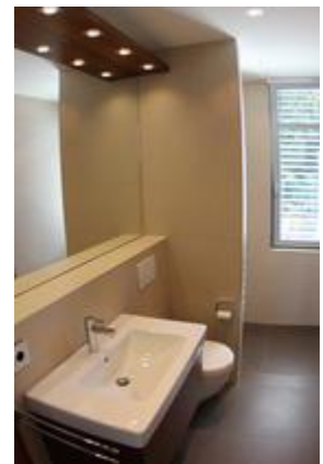
Gästebad mit sep. Dusche