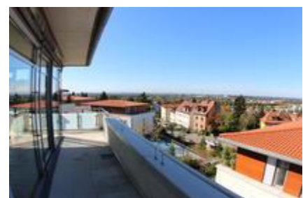
Terrasse NW Blick nach SW