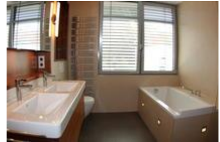
Wannenbad mit sep. Dusche