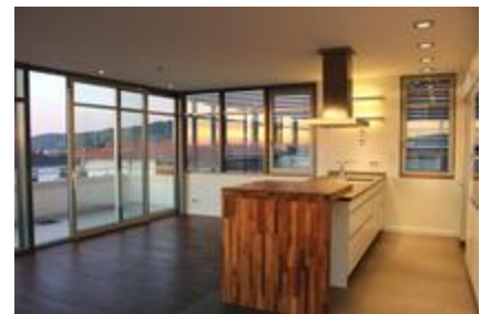
Küche Essen Terrasse NW