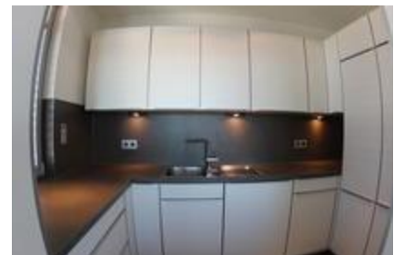
Hinterer Küchenteil mit 2.Spüle