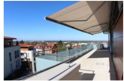
Terrasse SW mit Markisen