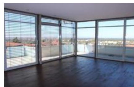
Wohnzimmer Blick nach Westen