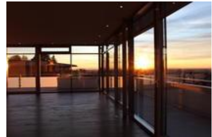
Sunset zu jeder Jahreszeit!