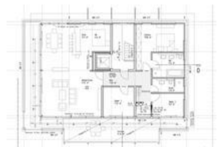
Grundriss Penthouse Weinheim